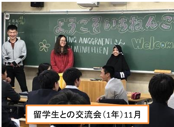
留学生との交流会(1年)11月