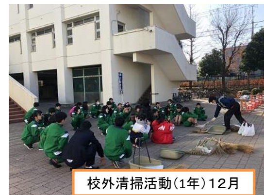
校外清掃活動(1年)12月