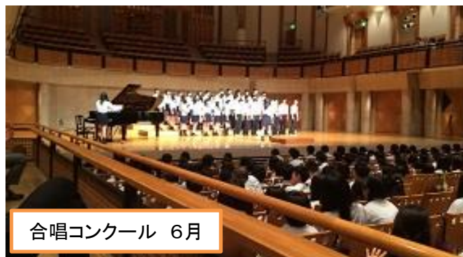
合唱コンクール 6月