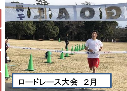
ロードレース大会 2月