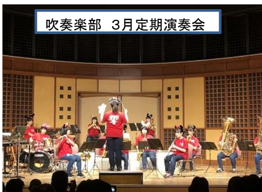
吹奏楽部 3月定期演奏会